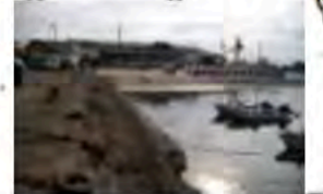
昭和9年に構築された荷揚用 護岸(階段式)は石造りで、 一部は現在も残されていま す。 13階段175m