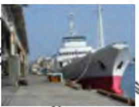
内港では魚の水揚げや競り が見学できます